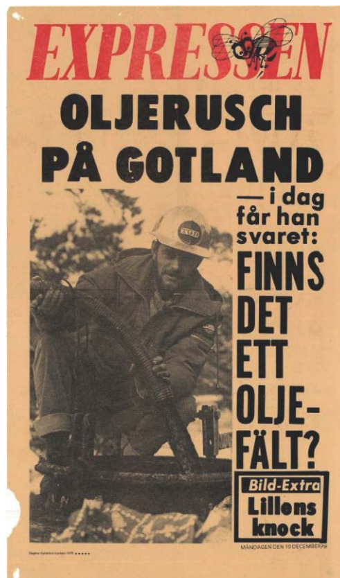
Expressens löpsedel 10 december 1979.

Integrering av geologiska, geokemiska och geofysiska data i kombination med nya rön vid satellitbildstolkning kan ge information om var det finns bättre förutsättningar att hitta nya oljefält. Detta leder med större träffsäkerhet fram till nya målområden för seismiska undersökningar och ny borring.