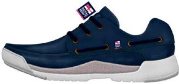
Exempel på sko av märket Royal Navy från den kollektion som LBM planerar att lansera våren 2011.

väldet. Den brittiska flottans image har byggts upp under århundraden och det är ett av världens äldsta varumärken. Licensprogrammet som LBM utvecklat tillsammans med den brittiska flottan, har tagits fram i syfte att uppnå ett klart definierat mål, att göra det möjligt för varumärket Royal Navy att skapa ett ökat strategiskt värde till det varumärke som den brittiska flottan byggt upp genom åren. LBM har till uppgift att se till att de värderingar och etiska normer som den brittiska flottan står för förs fram på ett korrekt sätt.