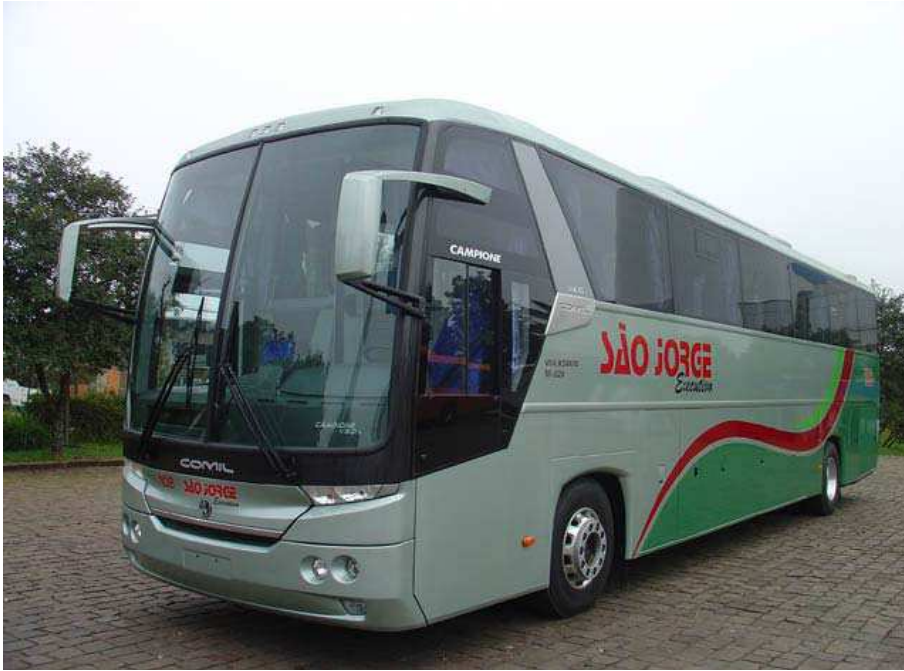
Ett exempel på Campione, den buss som Hartelex erbjuder på den ryska marknaden.

Den största risken som Axier ser med en investering i Hartelex är att bolagets prognoser varit alltför förhoppningsfulla. Axiers erfarenhet säger att det aldrig går som planerat med nya produkter, det uppstår alltid problem under resans gång. Dessutom sker verksamheten i ett helt annat land än det som ledningen befinner sig i vilket kan komma att medföra än fler problem. Axier konstaterar emellertid att bolaget VD har ett långt förflutet i det ryska affärslivet vilket torde minimera de problem som kan komma att uppstå.