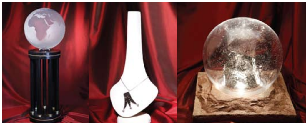
The Globe. Konstglas med blåstrad kartbild. Stativ i porfyr och guld Design: Jan Johansson