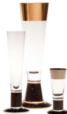
Service i 12 delar Helkristall och porfyr samt dekor i platina, silver eller guld.