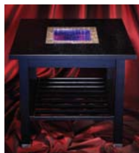
Bord i ek med infällning av porfyr och konstglas, tillverkat av MIND.

Förädlingen, arbetet med att forma, slipa och putsa till konstföremål, inredningsdetaljer och stilprodukter för vardagslyx sker lokalt och hos samarbetsparterna. WSM's mål är bästa kvalitet inom råvaror och tillverkning samt en hög nivå på designen för att produkterna ska ligga i segmentet "top line".