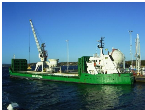
M/S Pallas Ocean lossar salt i Stenungsund

Efter krisen 2008 har många banker skärpt sin utlåningspolicy vilket gör att småföretagare ofta har svårt att få lån på banker och det är just småföretagare som Pallas Kredit vänder sig till. Pallas Kredits räntenetto var 2009/2010 cirka 7,5 procent, vilket bedöms öka de närmaste åren, då ränteläget i Sverige ökar undan för undan eftersom riksbanken fortsätter att höja reporäntan.