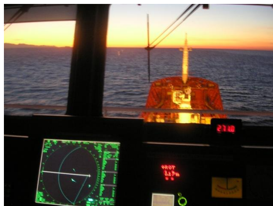
Pallas fartyg är utrustade med den senaste radartekniken samt med elektroniska sjökortssystem för säker navigering.