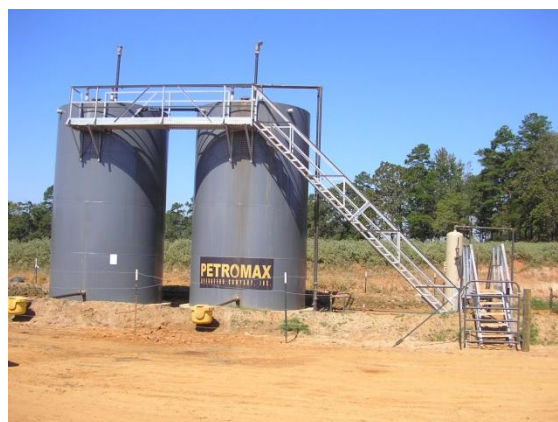
Cisterner för att förvara oljan i från oljekällan Schiflet 1H som Pallas är delägare i.