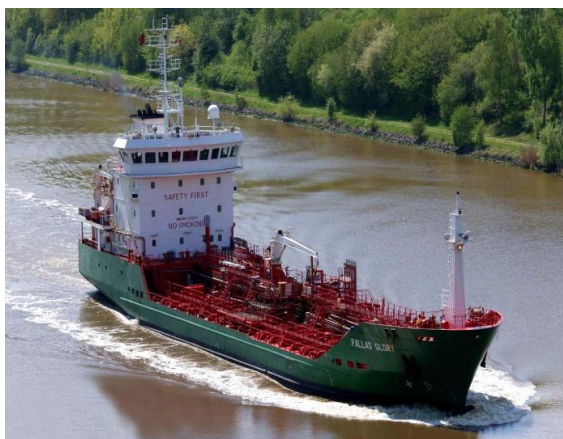
M/T Pallas Glory passerar Kielkanalen.